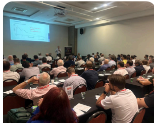
Encontro Técnico & Comercial Público Presença