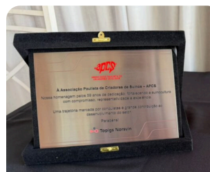
59 anos da APCS