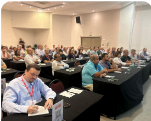
Encontro Técnico & Comercial Público Presença