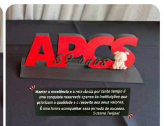
59 anos da APCS