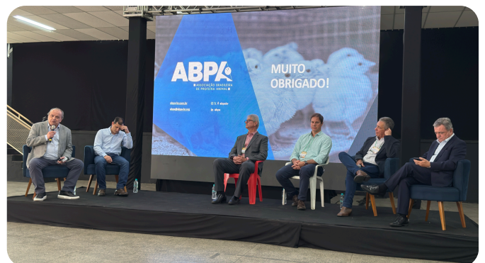
Painel sobre Competitividade da Produção de Aves e Suínos