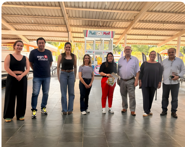
Salão de Degustação no Sou + Agro