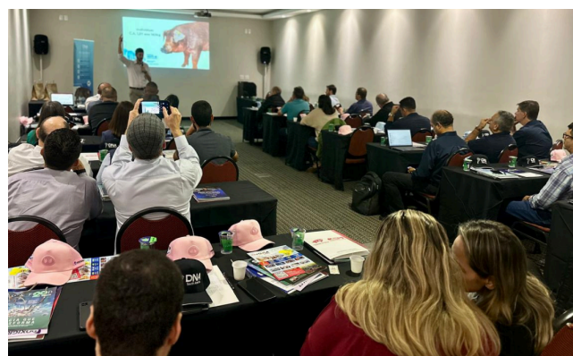
Encontro Técnico & Comercial