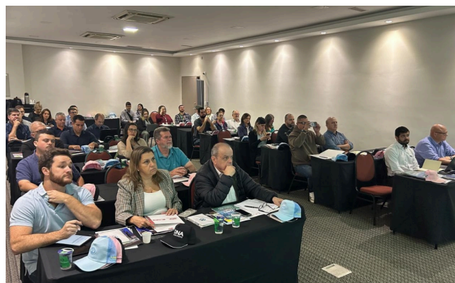
Encontro Técnico & Comercial