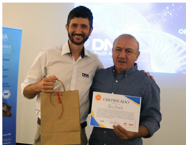
Encontro Técnico & Comercial